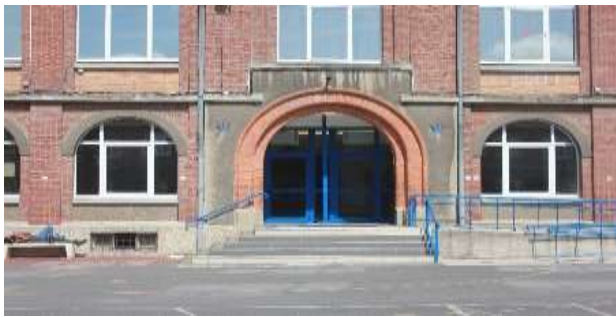
Entrée de la chapelle - Cour 1