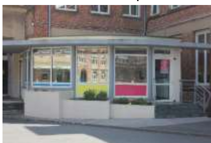
Bureau de la vie scolaire – Cour 1