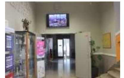
Hall d'accueil vers le bureau de M. FRENEL