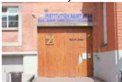
Entrée des élèves (229 Avenue du Maréchal Leclerc)