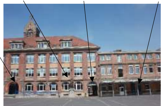
Vue en entrant dans l'établissement