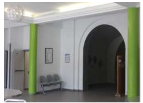
Hall de la chapelle